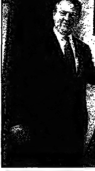
الرئيس التنفيذي لرويترز، بيتر جوب، يقم أمس في لندن بتوقيع أعمال الشركة

لندن - الفيس العريبي: أعلنت شركة رويترز القابضة للانباء والخدمات المالية أمس الثلاثاء ارتفاع ارباحها قبل خصم الضرائب بنسبة 17 في المئة في العام الماضي، وقالت انها ما زالت تامل توزيع فائض السيولة التقديسي على حملة الأسهم.